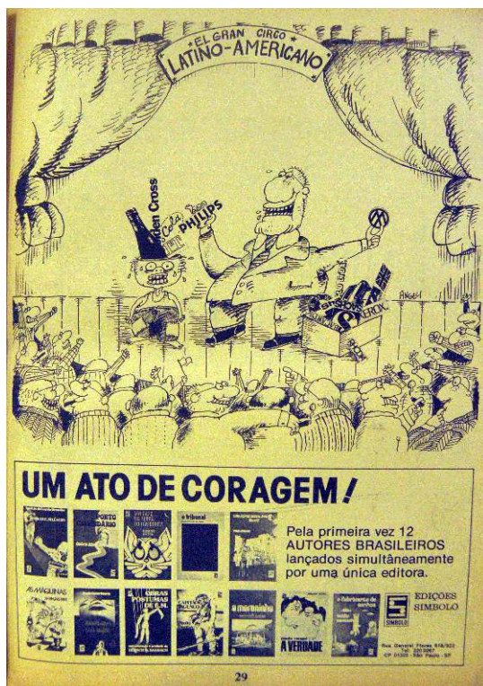
Illustration n°2 : Versus , n°3, début 1976, p.29