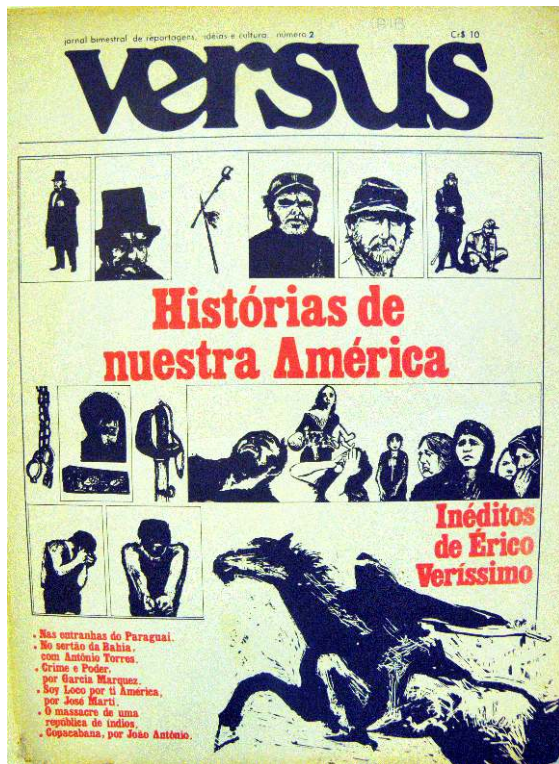
Illustration n°1 : Versus , n°2, décembre 1975-janvier 1976, p.1

Cet article propose également une réflexion appliquée au mensuel brésilien à propos des différentes significations du terme de « circulation », désignant à la fois un mouvement continu, circulaire et constamment renouvelé, le déplacement d'hommes et d'idées au sein de voies spécifiques de communication, le fait d'aller et venir d'un point à un autre, ainsi que le simple fait d'être diffusé, publié, de passer de main en main. Notre objectif est d'analyser, à l'aune de ces différentes pistes de définition, ce que les rédacteurs et dessinateurs de Versus ont permis de mettre en mouvement, ce qu'ils ont transmis, où, à qui et comment, et de quelle manière, enfin, ils ont élevé la création matérielle, politique et symbolique d'un espace transfrontalier voué aux transferts intellectuels et culturels, au rang de leurs principales revendications.