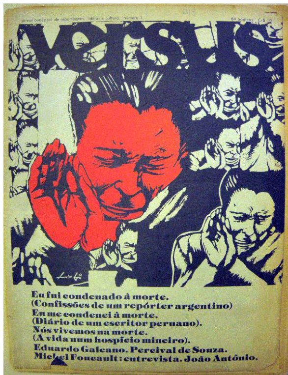
Illustration n°3 : Versus , n°1, octobre 1975, p.1